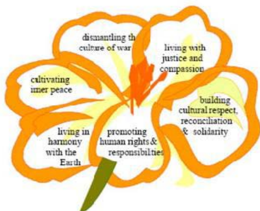
Figure-2. Flower-petal Model of Peace Education