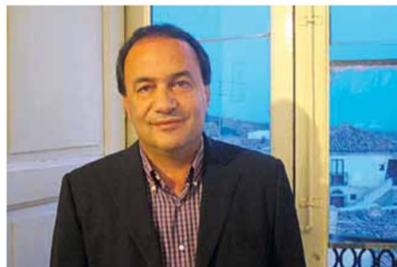
Domenico Lucano: gradonačelnik Riacea kaže da imigrantima treba dati priliku i kvalitetne programe

NO VRATIMO SE NA VANJSKU GRANICU EUROSKE UNIJE - U TOVARNIK. Mladić s kojim smo razgovarali nema posla i kao i mnogi mladi ljudi u Hrvatskoj planira potražiti sreću u inozemstvu.